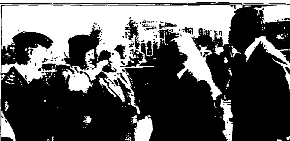
رئيس هيئة الزكوات ومدير الامن العام وكبار المسؤولين في استقبال جلالتهم